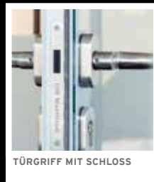
TÜRGRIF F MIT SCHLOSS