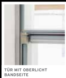
TÜR MIT OBERLICHT BANDSEITE