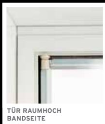
TÜR RAUMHOCH BANDSEITE